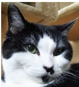
気高い姫や殿様 大歓迎です

猫が好きで、ネコと暮らしておりましたが、 最近、天国へと送り寂しい思いをしております。 また猫と暮らしたいと、良縁を求めています。