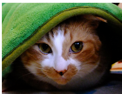
いたずらっ子でも 構いません