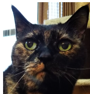
何色猫だか分からず とも構いません